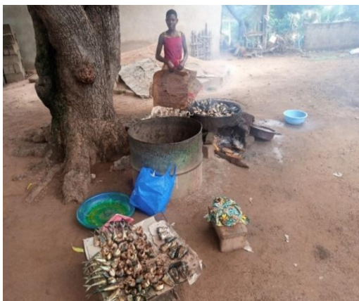
Photo n° 2 : Une aide-fumeuse en pleine activité

Ainsi, les espèces de poissons soumis au fumage à Katiola sont variées. Les fumeuses principales propriétaires des sites de fumage achètent le poisson frais à la poissonnerie en vue de le fumer. La quantité achetée varie d'une fumeuse à une autre en fonction de leur pouvoir d'achat. Cette quantité varie d'un carton à 5 cartons. Le poids des cartons de poisson varie de 10 kg à 20 kg et est fonction de l'espèce de poisson (Cf. Tableau n2).