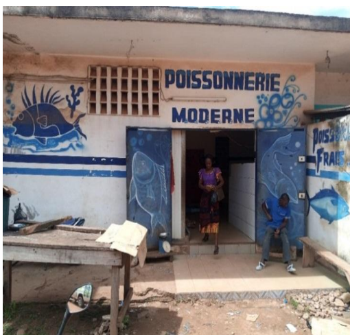
Photo 3 : Une poissonnerie, lieu d'achat du poisson à fumer

Plusieurs espèces de poissons sont proposées à la population de Katiola par les différentes poissonneries. Celles qui sont régulièrement achetées par les fumeuses sont le Chinchard ( Trachurus trachurus ), le hareng, bonite ( Sardasarda ) le maquereau ( Scromberscrombrus ), mademoiselle ( Apsilus fuscus ), la dorade ( Pagelus bogaraveo ) et brama ( Brama brama ). Ces espèces de poissons sont des poissons congelés, vendus dans les poissonneries (Photo 3). Selon les enquêtes, le maquereau et le hareng ont les prix les plus bas.