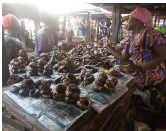
Photo n° 1 : Du poisson fumé en vente au marché

Lors de nos enquêtes, nous avons découvert que 79,07 % des aides-fumeuses sont encore des enfants. Elles ont moins de 18 ans. Cependant celles qui ont 46 ans et plus sont au nombre de 2. Par contre, la tranche des jeunes est de 16,29 %. Le poisson fumé est par la suite transporté au marché. Il est vendu par les fumeuses toujours aidées par les aides-fumeuses. Cette vente se fait sous deux formes. La forme fixe comme l'indique la Photo n° 1 et la forme mobile par des vendeuses ambulantes.